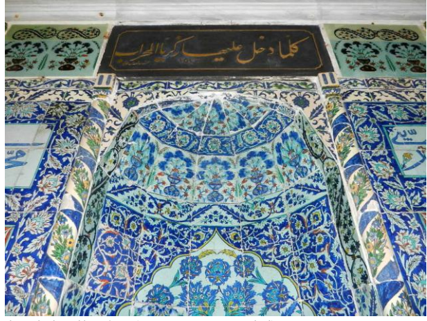
Resim 6: Kandilli Camii'nin çini mihrabı