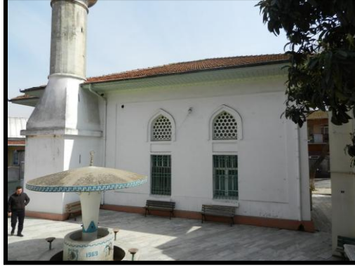
Resim 5: Kandilli Camii'nin güneybatı cephesi, (Hora Yapı Arşivi)