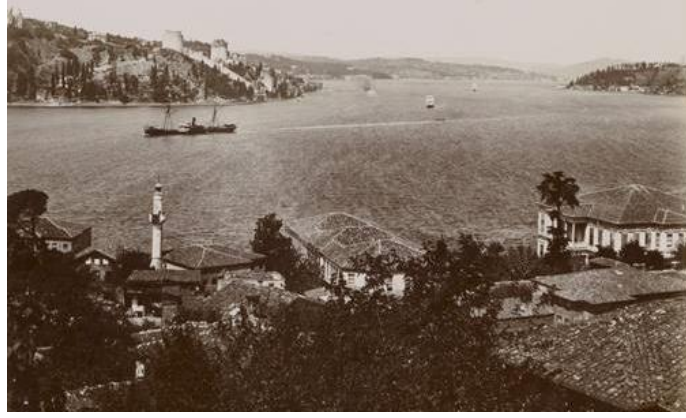
Resim 8: Gülmez Frères tarafından 1892 senelerinde çekilmiş bir fotoğraf (Genim, 2012; 637).