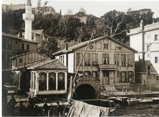
Resim 9: Maurice Meys tarafından 1906 senelerinde çekilmiş bir fotoğraf (Genim, 2012; 663)