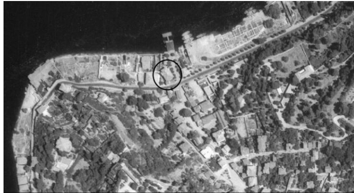
Resim 4: 1954 tarihli Hava Fotoğrafında, Kandilli Camii ve kiremit örtüsü