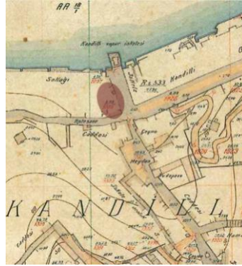
Harita 2: Anadolu Ciheti Haritası'nda Kandilli Camii'nin konumu (Dağdelen, 2008; AA 18/2)