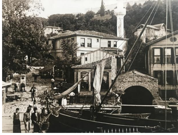
Resim 7: 1900 senelerinde çekilmiş bir fotoğraf (Genim, 2012; 661)