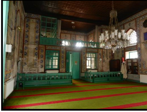
Resim 3: Harimin genel görünüşü, giriş kapısına doğru bakış, (Hora Yapı Arşivi)