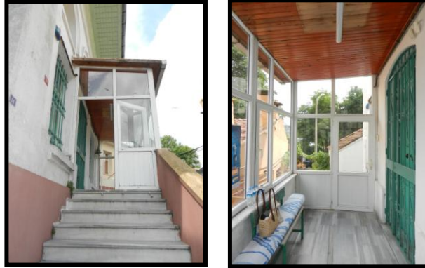
Resim 1: Mermer kaplamalı basamaklarla çıkılan plastik doğramalarla çevrili giriş mekânı, (Hora Yapı Arşivi)