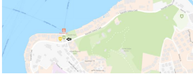
Harita 1: Kandilli Camii'nin bugünkü konumu, İBB şehir haritası ( https://sehirharitasi.ibb.gov.tr )