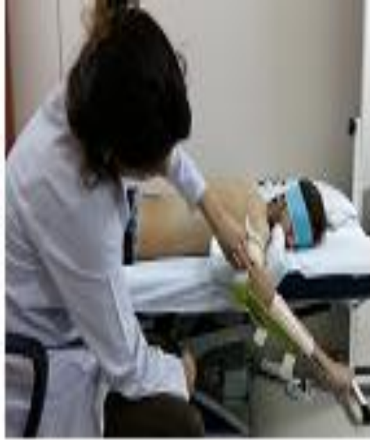
Resim 5.1.5: Omuz eksternal rotasyon propriosepsiyon deęerlendirmesi