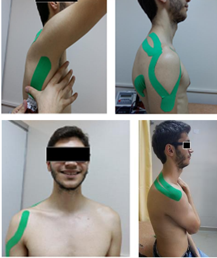
Resim 5.2.4 Kinezyolojik bantlama uygulaması

gererek bitim noktası ise skapulanın margo lateralisinden gerim yapmadan yapıştırılarak bantlama tamamlandı (Resim 5.2.4).