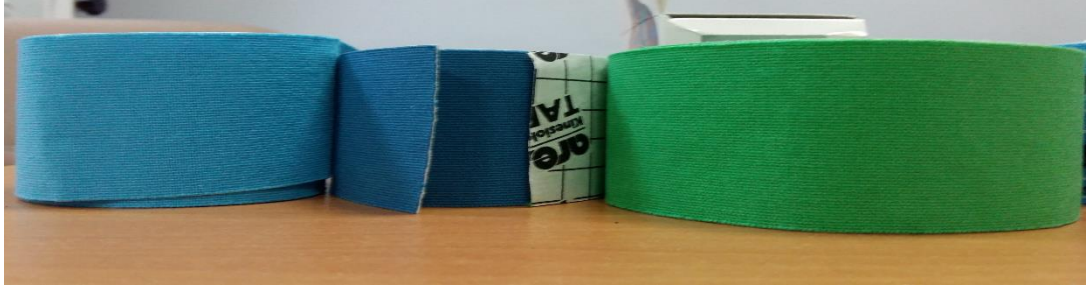
Resim 5.2.3: Kinezyolojik bantlar

Kinezyolojik bantlama grubuna, geleneksel fizyoterapi protokolü yanısıra kinezyolojik bantlama uygulandı. Kinezyolojik bantlama için 5 cm'lik bant (Ares Kinesiology TAPE®) kullanıldı (resim 5.2.3).