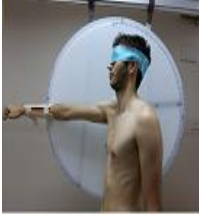
Resim 5.1.2: Omuz fleksiyonu propriosepsiyon deęerlendirmesi