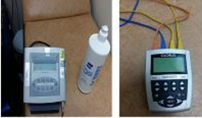
Resim 5.2.2: Ultrason ve TENS Cihazları