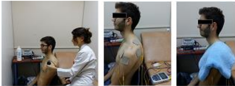
Resim 5.2.1 Ultrason , TENS ve Hotpack ve Uygulamaları

Ultrason fizyolojik, mekanik, termal, nontermal, kimyasal etkilere sahiptir. Uygulama şekli devamlı ve kesikli olarak ikiye ayrılır. Devamlı ultrason daha çok termal etki yaratmak için kullanılırken kesikli ultrasonun kavitasyon etkisi vardır. Kliniklerde çoğunlukla kullanılan US dalgalarının frekansı 0,8-3 MHz, tedavi dozu ortalama 1,5w/cm 2 dir. Böylece geniş bir alan tedavi edilir ve ısının bir bölgede birikimi önlenmiş olur. Bir seansta ortalama 5-15 dk. uygulama yapılır, Özdiçler ve ark (63). US, etkilenen omuza haftada 5 gün toplam 10 seans, günde bir kez, 5 dakika süreyle, 1,2-1,5 W/cm 2 , rotator manşet bölgesine tam temas tekniği ve dik açıyla uygulandı. Geleneksel fizyoterapi ve rehabilitasyon grubuna; 5 dk US, 20 dk TENS, 20 dk HP uygulandı (Resim 5.2.1 ve Resim 5.2.2).