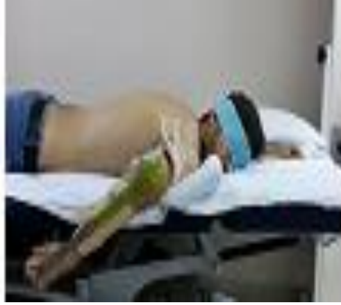
Resim 5.1.6: Omuz internal rotasyon propriosepsiyon deęerlendirmesi

Omuz internal ve eksternal rotasyonu eklem pozisyon hissi geleneksel gonyometre ekleyerek tasarladığımız açı göstergeli atel ile yüzüstü pozisyonda gözler kapalı olarak 30, 45, 60 ve 90°'lerde ölçüldü (Resim 5.1.5 ve Resim 5.1.6).