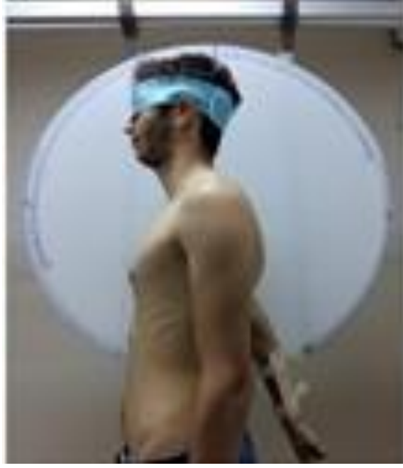
Resim 5.1.4: Omuz ekstansiyonu propriosepsiyon deęerlendirmesi