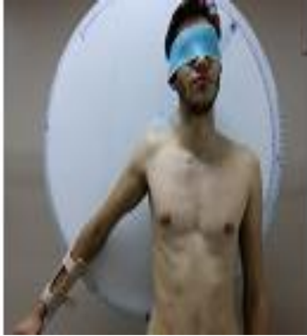
Resim 5.1.3: Omuz abduksiyonu propriosepsiyon deęerlendirmesi