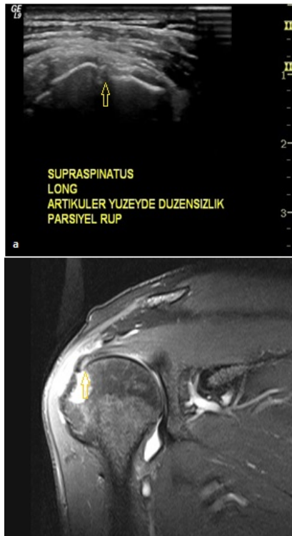
Şekil 2: Ultrasonografi imajında(a) suprapinatus tendon distal kesim artiküler yüzde parsiyel yırtık ile uyumlu düzensizlik(ok), Koronal plan PD TSE FS MR imajda (b) supraspinatus tendonu distal artiküler yüzde parsiyel yırtık(ok), subdeltoid effüzyon ve humerus başında dejeneratif değişiklikler görülüyor

Ultrasonografi, manyetik rezonans görüntüleme ile parsiyel yırtık tanısı alan 14 olgunun 10'unu saptarken 1 olguyu tam kat yırtık, 3 olguyu ise tendinosis olarak değerlendirmiştir. Ultrasonografinin parsiyel yırtık olarak değerlendirdiği 1 olgu MR incelemede tam kat yırtık tanısı almıştır. Ultrasonunun supraspinatus tendonu parsiyel yırtıklarında duyarlılığı %71, özgüllüğü ise %98'dir (Şekil 2).