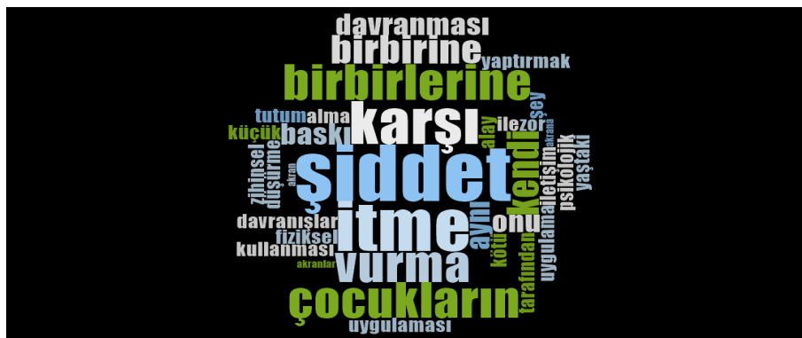
Görsel 1. Öğretmenlerin akran zorbalığı kavramına ilişkin çağrışımları

“Küçümseme, onu sınıf içinde yapma zor durumda bırakma” (Ö28) ifadesinde olduğu gibi öğretmenlerin altısı akran zorbalığını “küçümsemek” kavramı ile bağdaştırmışlardır.