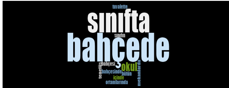
Görsel 5. Öğretmenlerin akran zorbalığının gözlendiği ortamlara ilişkin görüşleri

Görüşülen öğretmenlerden 11’i, “ İsim takılması okul bahçesinde olmuş. ” (Ö2) ifadesinde olduğu gibi akran zorbalığının bahçede gerçekleştiğini, 10’u “ ...teneffüslerde sınıfın içinde ” (Ö29) ifadesindeki sınıfta uygulandığı dile getirmiş, öğretmenlerden biri (Ö23) özellikle kız öğrencilerin tuvalette akran zorbalığı uyguladıklarını “ Teneffüs ile öğretmenin derse girdiği süreç içerisinde kızlar en çok tuvalette kavga ediyorlar. ” şeklinde ifade etmiştir.