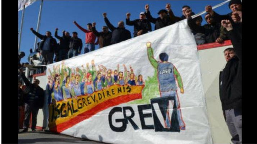
Resim 9. 2014 Yılı Greif İşçileri Direnişinden Bir Görüntü. Kaynak:

İstanbul Hadımköy'de kurulu bir Amerikan tekeline ait Greif çuval fabrikasında işçiler taşeron sisteminden vazgeçilmesi ve ücretlerinin iyileştirilmesi yönündeki temel taleplerini dile getirerek fabrikayı işgal ettiler. 60 gün süren grev sürecinde işçiler fabrikadan polis zoruyla çıkarıldılar. Fabrikadaki çuval bezlerine yine fabrikadaki tekstil boyaları ile yapılan bu resimler, emeğin bir çeşit müdafaasının temsili ve "insani yaşamın sahiplenilmesi" işlevi görmüştür.