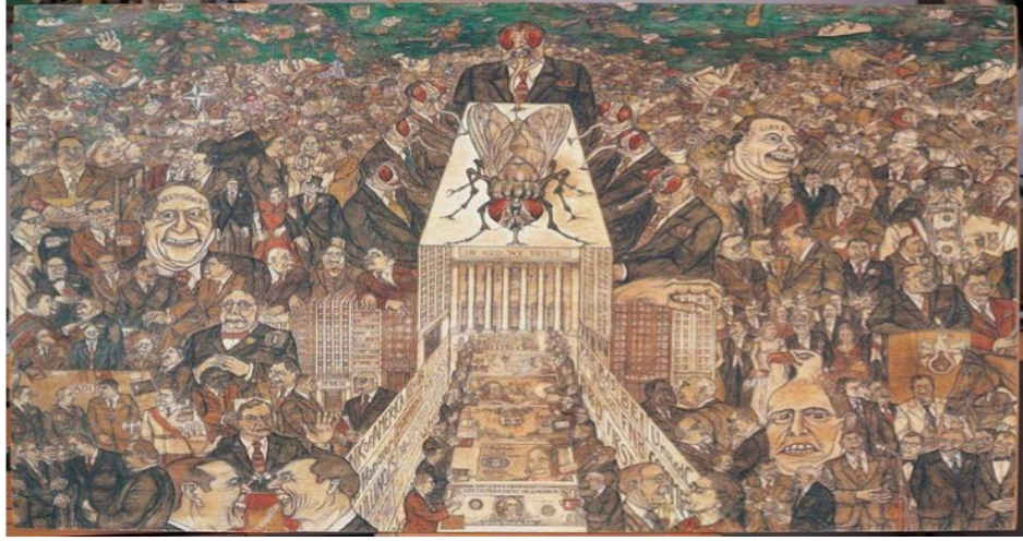
Resim 13. Yüksel Arslan, 1976-77, "Kapital Serisi", (Seri 186), Kâğıt üzerine karışık teknik, 73,5 x 108,5 cm. Kaynak: Yürür: 2019: 19

Fotoğrafın icadı ve yaygınlaşması 19. yüzyılda çalışmanın görsel temsilindeki önemli gelişmelerden biridir. ABD’de Jacob Riis ve Lewis Hine isimli iki fotoğraf sanatçısının portföyleri çalışmanın temsili ile özdeşleşmiştir. Jacob Riis, 19. yüzyıl sonlarında New York yoksullarının yaşam koşullarını yansıtan fotoğrafların öncüsü olmuştur. 1890 yılında yayımladığı How the Other Half Lives isimli kitabında yoksulların acınası yaşam koşullarını gösteren fotoğraflara yer vermiştir. Emek fotoğrafçılığı geleneğinin ikinci önemli ismi olan Lewis Hine, çalışmalarının ana iki yönelimini şu şekilde belirlemiştir: Birincisi, “Yapmak istediğim iki şey vardı. Bunlardan ilki düzeltilmesi ve takdir edilmesi gereken şeyleri göstermek”, ikincisi ise “sanayi çağı insanının makinelerin tam bir parçası haline geldiğine yönelik düşüncüyü yıkmaya çalışarak işi ve işçiyi övmek” (Strangleman ve Warren, 2015: 80). Hine New York’taki Empire State Building’in inşaat aşamalarını gösteren fotoğraflar serisinde yer alan en ünlü fotoğrafları başta olmak üzere çalışmalarında “kahraman işçiye ve emeğe” dikkat çekmiştir (Orvell, 1995).