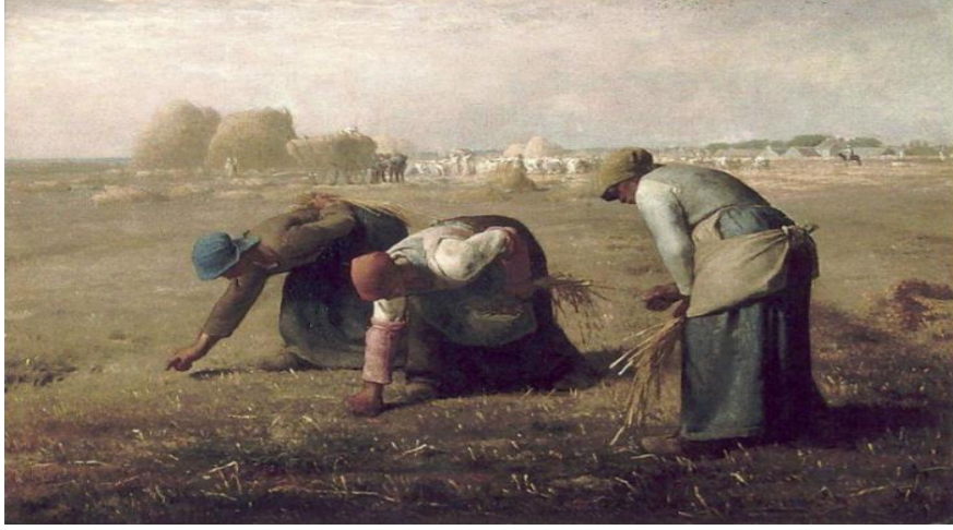
Resim 8. Jean-François Millet, 1857, “Başak Toplayan Kadınlar” Tuval üzerine yağlı boya, 83.5x110cm. Orsay Müzesi, Paris, Fransa. Kaynak: Yürür, 2019: 30.

1857 tarihli “ Başak Toplayan Kadınlar ” isimli çalışmasında Millet, hasadın ardından yere dökülen başak tanelerini toplayan üç kadını eserinin merkezine koymuş ve arka planda ise hasadı tamamlanmış ürünler üst üste deste biçiminde yığılmış ve yanında da birçok çalışan karaltı olarak görülmektedir. Yine arkada sağ tarafta devriye gezen üst düzey atlı bir kişiye merkezde konumlandırılmış üç kadın işçiden çok uzakta yer verilmiştir. Ön planda resmin merkezinde yer alan üç kadının yaptığı işin iktidar sahiplerince bir değer ifade etmediği açıktır. Köylüler ve işçi sınıfı yani toplumun alt katmanlarında yer alan kesimdeki insanlar değersiz görülürken, Millet bu insanlara sanatının merkezinde yer vermiştir. Böylelikle toplumun elit kesimleri günlük yaşamlarında görmeye bile tahammül edemedikleri emekçi sınıftan insanları artık sanat eserlerine konu edilen yapıtlar olarak sergi salonlarında görmek durumunda olacaklardır (Yürür, 2019: 31).