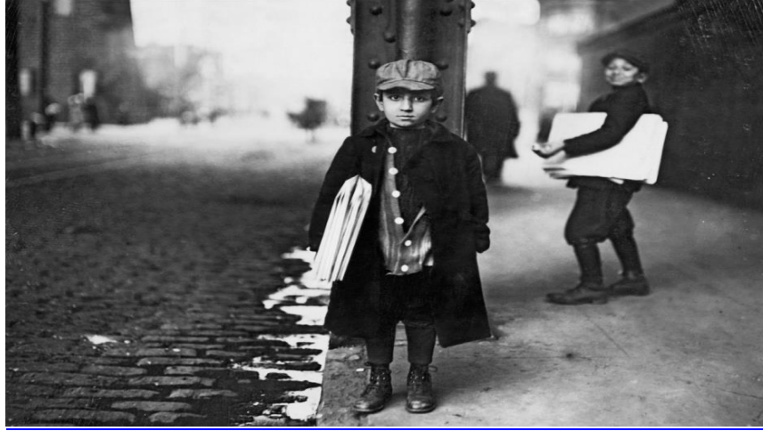
Resim 16.