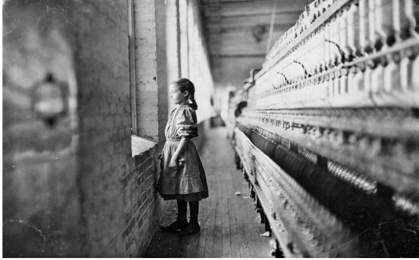
Resim 18.

1917 Rus Devrimi ile birlikte önce Lenin sonrasında da Stalin dönemlerindeki Sovyet yönetimleri için sanat son derece önemli bir iletişim ve propaganda aracına dönüşmüştür. Bu dönemlerin sanat eserlerinde işçilerin onurlu kahramanlar olarak resmedildiği bir emek betimleme biçimi geliştirilmiştir. Bu sosyalist gerçekçi tarz, merkeze sıradan işçileri yüksek düzeyde biçimlendirilmiş formlarda koyarak, devletin işçilerin önemine dayanan siyasal ideolojisini yansıtmaktadır. Bu tür sanatta, Moskova