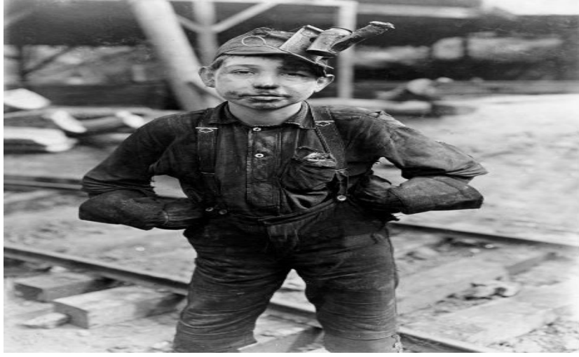
Resim 15.

burada alıŐıyor. Günde bir dolar kazanıyor. Teksas'taki kereste fabrikasındaki bir ocuk..." (Sanatatak, 2018).