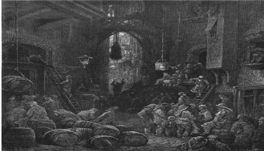
Resim 4. Victoria dönemi Londra Sokaklarında İşçiler.