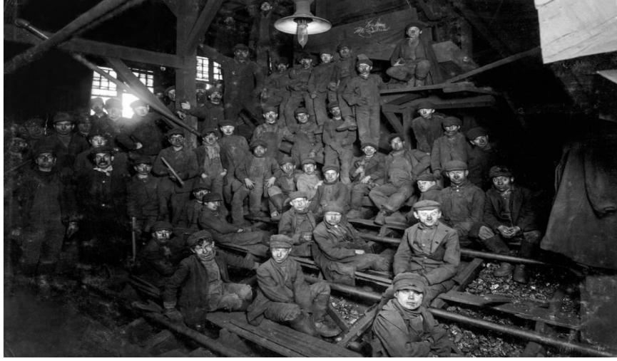
Resim 17.