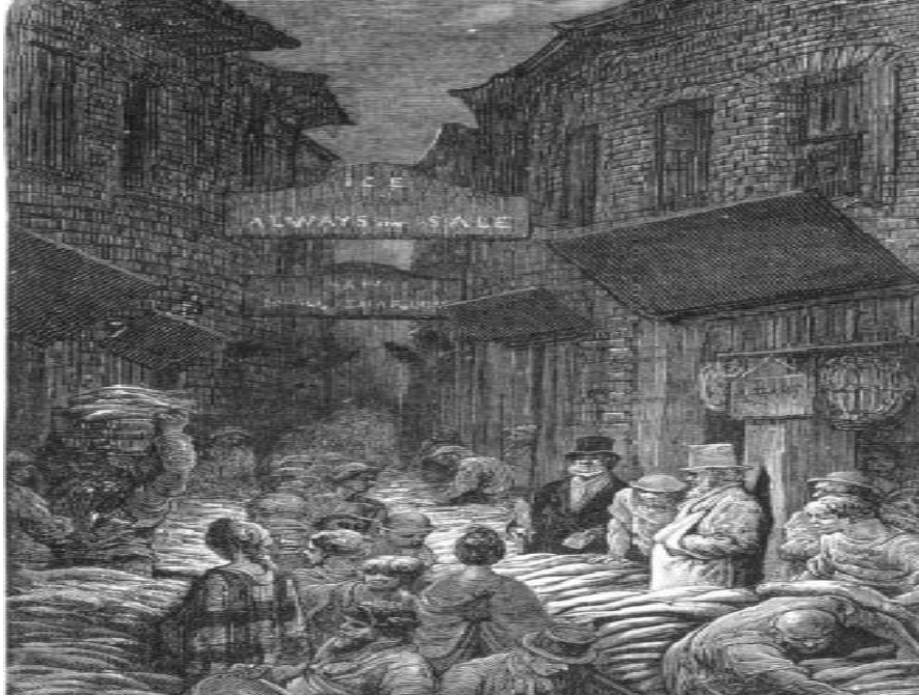
Resim 5. Victoria Dönemi Londra Sokaklarında İşçiler.