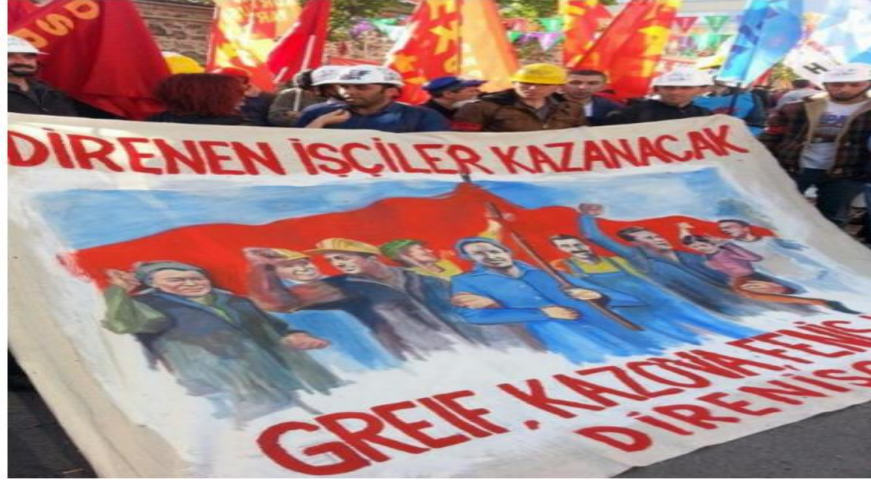
Resim 12. 2014 yılı Greif İşçileri Direnişinden Bir Görüntü.

Yüksel Arslan bu eserinde her kesimden iktidar yapılarını bir arada göstermek istemiştir. Dünyanın dört bir yanındaki iktidar sahiplerinin aynı masa etrafında toplanıp karar aldıkları bu tasvirde; iktidar sahiplerinin yüzlerindeki mutlu ve aşağılayıcı gülümsemeler, karar alırken toplumların tüm kesimleri üzerinde sahip oldukları ezici gücü betimlemektedir. Bu resim iktidar erkine sahip olan kesimin toplumsal yapıları nasıl biçimlendirdiğine ve sömürdüğüne de dikkat çekmektedir (Yürür, 2019: 19).