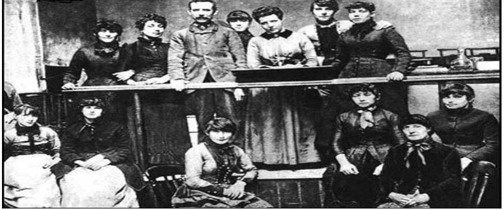
Resim 14. 'Bryant ve May Fabrikasındaki Kibrit İşçileri', Londra 1888.