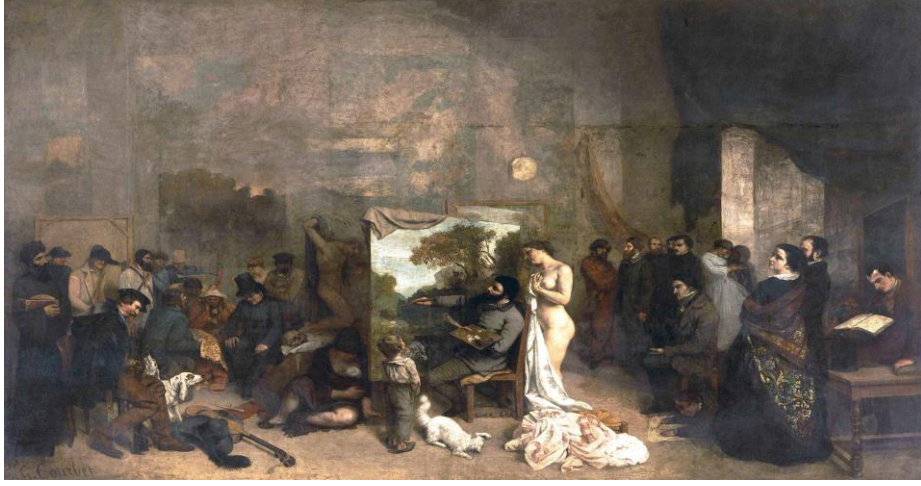
Resim 2. Gustave Courbet; Ressamın Atölyesi, 1855, Tuval üzerine yağlıboya, 361X598 cm, Musee d'Orsay, Paris.

Sanayi devrimi sonrasında güçlenen kapitalist sömürü düzeni ile sanat üzerindeki burjuvazi egemenliği daha da yoğunlaşmıştır. 20 yüzyılda burjuva sınıfının bu egemenliğine son vermeyi amaçlayan Avangardistler, burjuva sınıfının sanat anlayışının sanatı soyutlayarak yaşamdan kopardığını ve elitize ettiğini ileri sürerek, sanatın bir yaşam pratiğine dönüştürülmesini amaçlayan ürünler vermişlerdir.