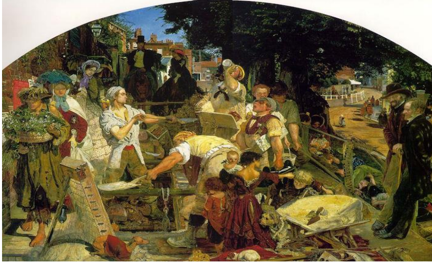
Resim 6. Ford Madox Brown, Work , 1852-65, oil on canvas, 137 x 197,3 cm (Manchester City Art Galleries). Kaynak:

Ford Madox Brown'un 1852-1865 yılları arasında çizdiği 'Work' isimli tablosu yine Victoria dönemindeki çalışma, el emeği ve erkeksi emeğin toplumsal konumuna ilişkin bakışın güçlü bir ifadesini tasvir etmektedir. Tabloda üç temel işçi figürü egemendir. Bir taraftan emekçilerin sıkı çalışmaları betimlenirken diğer yandan da çalışan adamlar vakur ve sağlıklı; aynı zamanda da çalışmaları gerekli, yararlı ve onurlu bir biçimde konumlandırılmıştır. Tablo Victoria dönemi toplumunun güçlü bir sosyal tanımının yanısıra toplumdaki bütün sosyal sınıfların kadın ve erkeklerin çalışmalarına egemen olan bakış açısını da yansıtmaktadır (Strangleman ve Warren, 2015: 79).