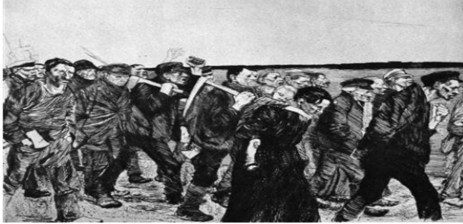
Resim 1. Kathe Kollwitz, Dokumacılar, 1897, Gravür, Stadmuseum, Münih, Almanya.

Bu çalışmamızda eskilerin deyimiyle bahr-i bî pâyân, ucu bucağı olmayan engin bir deniz olan sanatın gökkuşağından işçi sınıfının muhtelif renk tezahürlerini yansıtmaya çalıştık. Emeğin görsel, işitsel ve yazınsal sanatlardaki tezahürlerini incelememize dahil ederken hem görsel hem de işitsel özellikleri bir arada barındıran yedinci sanat sinemadaki emek tezahürlerini 1 hem çalışmanın hacmini gözeterek hem de ileride bu konuda daha kapsamlı bir çalışma yapmayı düşündüğümüz için bu çalışmanın kapsamına alamadık.