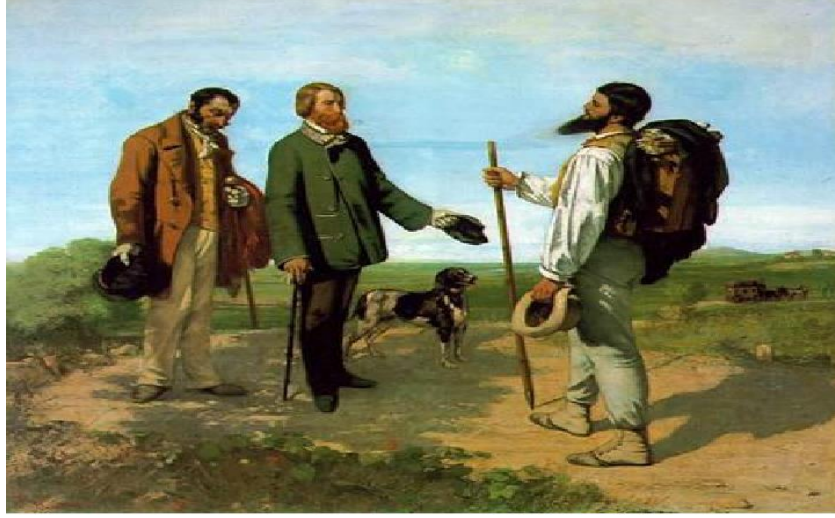
Resim 7. Gustave Courbet, 1854, “Günaydın Bay Courbet”.

kaçınmamışlardır. Bunların önde gelenleri arasında Gustave Courbet, Jean François Millet ve Honore Daumier sayılabilir.