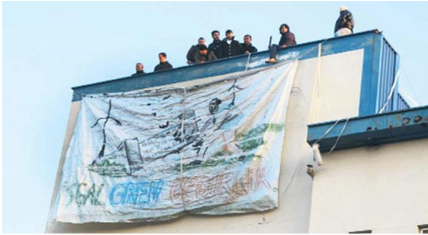
Resim 10. 2014 yılı Greif İşçileri Direnişinden Bir Görüntü.

Pratik bir ihtiyacın ürünü olarak ortaya çıkan bu resimler, yalnızca bir afiş olarak bakıldığında, sanatsal açıdan dikkate alınmaya değer bir şey olma özelliğini taşımazlar belki de; ancak sanatın bir pratik olarak toplumsallaşması açısından bakıldığında, buradan edinilen bilişsel deneyim önem arz eder. Bu deneyim yeni sanatın geleceğinin toplumsallıkta olacağı fikrini yeşertmektedir (Şimşek, 2019: 50-51).