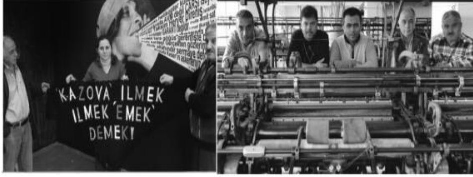
Resim 11. Kazova İşçileri: Bu Yılın Modası Direniş, 2013.