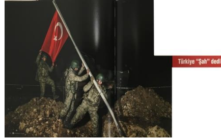
Görsel 3: “Türkiye Şah Dedi” başlıklı haber fotoğrafı

arka planında yer alan askerin ise elinin silahta olmasından dolayı güvenlik, hazırlık ve dikkatli olma durumu ekseninde birbirine bağlanmaktadır. Bu görselde belirsizlik görüntüsel ve yoğrumsal göstergeleri birbirine bağlayan temel ulamdır.