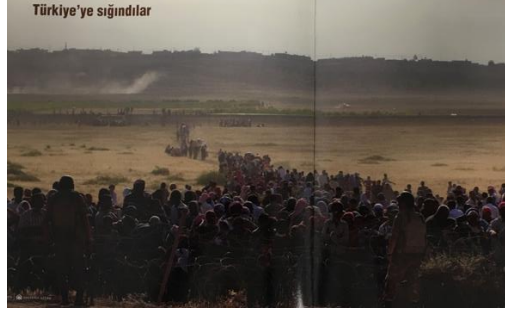
Görsel 1: “Türkiye’ye Sığındılar” başlıklı haber fotoğrafı

Anadolu Ajansı Almanaklarından belirlenen kriterlere göre seçilen 10 fotoğraf göstergebilimsel yöntemle analizi yapılmıştır.