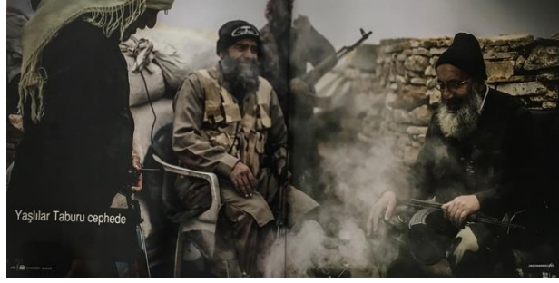
Görsel 2: “Yaşlılar Taburu Cephe” başlıklı haber fotoğrafı

çağrıştırır. Yaşam ve ölüm çizgileri arasındaki ince nokta ise yerleşim yerinden başlayan, dikenli tellerle askerlerin yer aldığı en ön planda son bulan betimlemeyle anlatılmıştır. Ön plan da yer alan dikenli tel ve nöbet tutan askerler ise güvenlik, canlılık, devamlılık, yaşamı en arka planda yer alan yerleşim yeri ve duman ise ölüm, felaket, çaresizlik ekseninde birbirine eklenmektedir. Bu görselde mutsuzluk ve mutluluk karşıtlığı görüntüsel ve yoğrumsal göstergeleri birbirine bağlayan temel ulamdır.