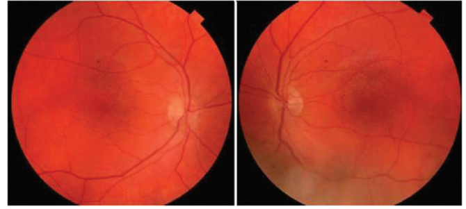
Resim 1: Renkli Fundus; Fundus fotoğrafında albinotik retina görülmektedir. Fovea refleksi silik, sarı luteal pigment görülüyor, pigment eksikliğine bağlı büyük koroid damarlar belirgin olarak seçilebiliyor.

Her iki gözde yıllardır görme azlığı şikayeti olan 32 yaşındaki erkek hastanın yapılan muayenesinde her iki gözde tashihli görme keskinliği ondalık Snellen sisteminde 0.7 düzeyindedi. Hastada normal deri ve saç rengi mevcuttu. Ön segment muayenesinde belirgin fotofobisi vardı ve iris transilüminasyon defekti tespit edildi. Göz içi basınçları her iki gözde 14 mmHg olarak ölçüldü. Fundus muayenesinde ve renkli fundus resimlerinde her iki gözde retina hipopigmenteydi, büyük koroid damarları rahatlıkla seçiliyordu. Fovea refleksi silikti. Foveada luteal pigment defekti vardı (Resim 1). Yapılan optik koherens tomografi (Spectralis OCT Heidelberg Engineering, Carlsbad, CA) incelemesinde her iki gözde foveal kesitlerde fovea çukurluğunun tam oluşmadığı ve fovea bölgesinde olmaması gereken iç retina katmanlarının devam ettiği gözlemlendi. Ancak fovea bölgesinde eksternal limitan membran, fotoreseptör ve retina pigment epiteline ait bandların normal olduğu gözlemlendi (Resim 2). FOF incelemede ise foveada normalde görülen otofloresan blokajının olmadığı saptandı (Resim 3).